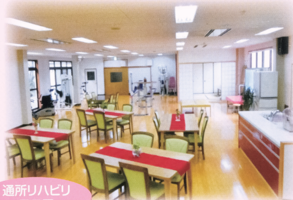
通所リハビリフロア